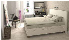
nexus decor render